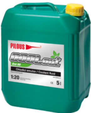
COOLcut Eco 65

Mimo použití na pásových pilách je určen i pro obráběcí operace prováděné jak na konvenčních obráběcích strojích, tak i na NC a CNC obráběcích centrech.