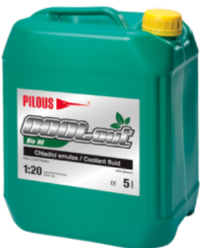
COOLcut Bio 90

Mimo použití na pásových pilách je určen i pro obráběcí operace prováděné jak na konvenčních obráběcích strojích, tak i na NC a CNC obráběcích centrech.