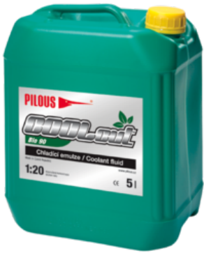
COOLcut Bio 90

COOLcut Bio 90 – universales, nach OECD 301-D gut biologisch abbaubares Kühl- und Schmier-Emulgieröl. Biologische Abbaubarkeit 90 % nach 21 Tagen. Dank ihrer leichten biologischen Abbaubarkeit ist es in jedweder Außenumgebung anwendbar, ohne die Umwelt zu beeinträchtigen. Empfohlene Konzentration: 4-7 %. Packung: 5 Liter. Verdünnung: 1:20.