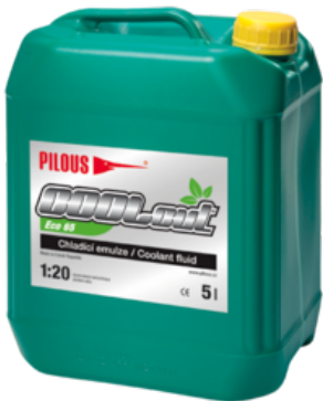
COOLcut Eco 65

Neben der Verwendung an Bandsägen ist sie für Bearbeitungsvorgänge sowohl an konventionellen Bearbeitungsmaschinen, als auch an NC-/CNC-Bearbeitungszentren vorgesehen.