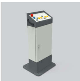
OPM - L

Bedienpult OPM-M Die Basisversion des Bedienpultes inkl. Schaltschrank. Damit können Sie ein Gerät über Komponenten der XMK-Anlage steuern.