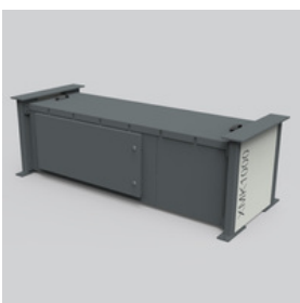
Hydraulic Box BHA

Bedienpult OPM-XL Eine erweiterte Version des Basis-Bedienpultes inkl. Schaltschrank. Ermöglicht die Steuerung mehrerer Komponenten der XMK-Anlage.