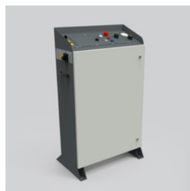
OPM - XL

Bedienpult OPM-L Eine erweiterte Version des Basis-Bedienpultes inkl. Schaltschrank. Ermöglicht die Steuerung mehrerer Komponenten der XMK-Anlage.