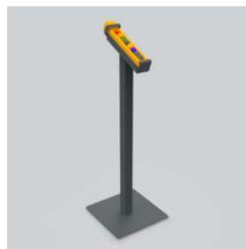
OPM - M

Stütze ZKN/MNY Stütze zur Erhöhung der Tragfähigkeit (ca. 5t), Steifigkeit und Stabilität des Stammspeichers. Durch den Einsatz einer Stütze wird die dynamische Belastung des Stammspeichers und natürlich auch die Lebensdauer deutlich erhöht.